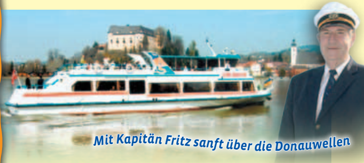
Mit Kapitän Fritz sanft über die Donauwellen

☑ Tagesabschluss kann organisiert werden.